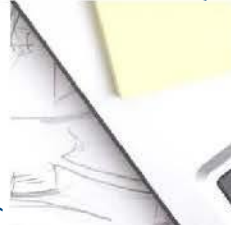
Zszywacze, Pistolety do kleju, Akcesoria