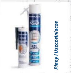
Piany i Uszczelniacze