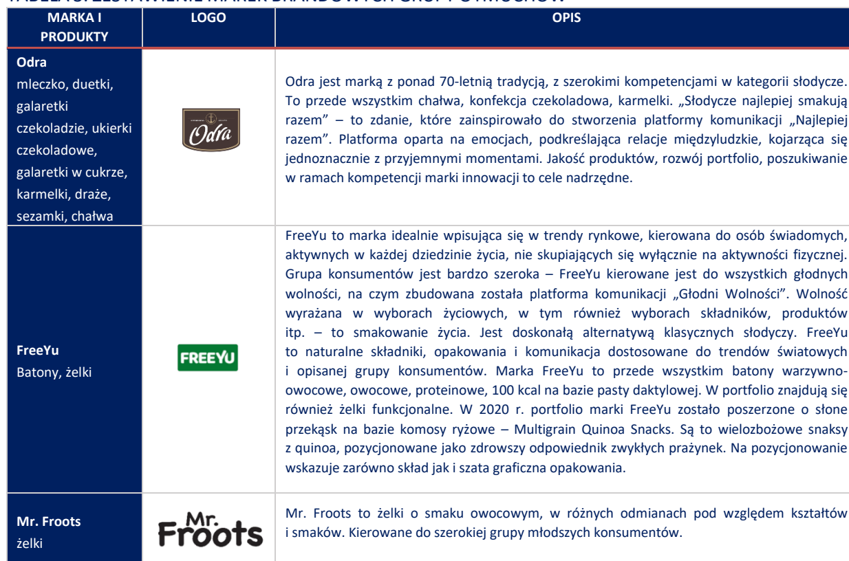
TABELA 3. ZESTAWIENIE MAREK BRANDOWYCH GRUPY OTMUCHÓW

Oferta produktowa pod brandami Grupy Otmuchów obejmuje w szczególności wskazane poniżej pozycje.